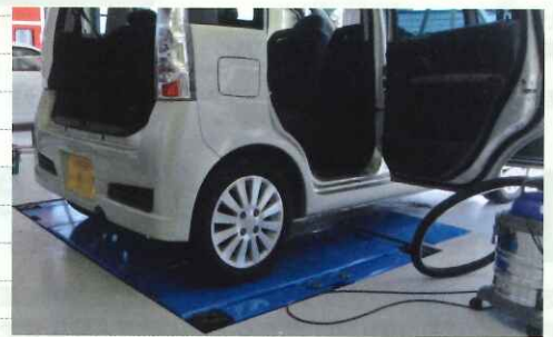
修正機やリフト、タイヤチェンジャーなども導入

「水性塗料は調色で少し難しい部分もありますが、塗装に関しては溶剤塗料に比べムラになりにくく非常に塗りやすく感じています。塗装ブースはお客様が入りやすい印象にしたいと赤のボディーにしました。ブースが国道を走る車からも目立つので「あれは何?」と興味を持たれるようになり、ネットで検索される回数が急激に増えました。作業を行なう上でのメリットも多くありますが、今はそれ以上に宣伝効果としてのメリットを大きく感じています。」