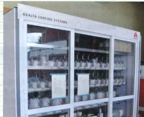
環境に配慮し水性塗料を導入