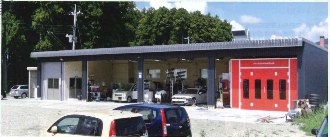
今年4月に開設された「Growing」の新工場

「創業当初は思うように売上が伸びず、厳しい状況が続いていたのですが、お客様の紹介でレンタカー事業を始めてから徐々に経営が安定してきました。ただ钣金塗装については技術や経験がありながら、環境や設備がないために外注に出さなければならぬことにもどかしさを感じていて、いつか自社内で钣金塗装を行えるようになりたいとの思いはずっと抱えて