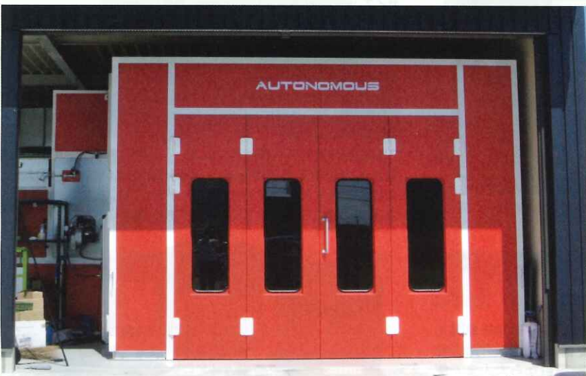
工場の新設に際しご購入頂いたマルテオリジナル塗装ブース「AUTONOMOUS」国道からも目と際目を引く真っ赤なボディ