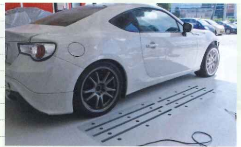
修正機やリフト、タイヤチェンジャーなども導入