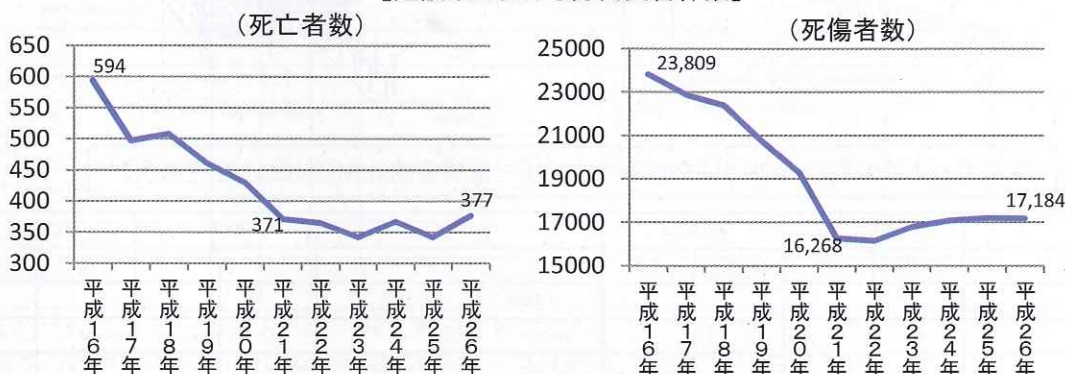
【建設業における労働災害件数】